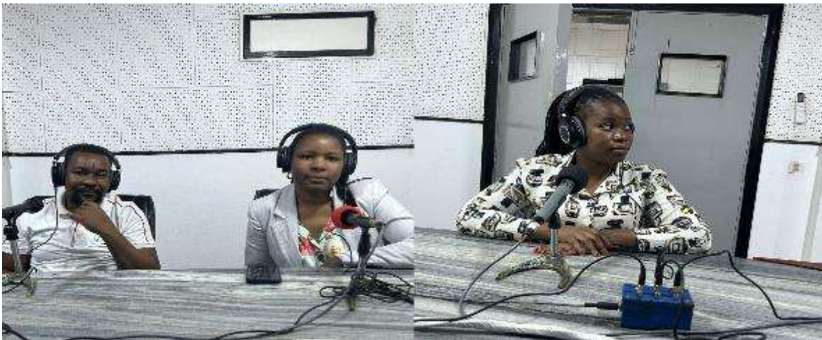
Fotos: Debate radiofónico