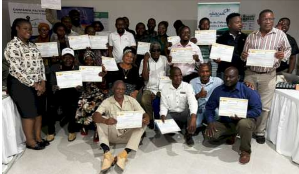
Foto: Formação sobre Cidadania Sanitária