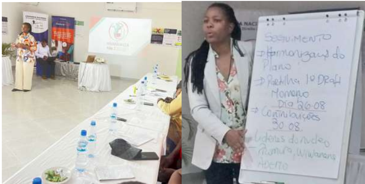
Fotos: formação sobre Cidadania Sanitária

Estiveram presentes neste curso 12 organizações de Sociedade civil baseadas na cidade de Pemba, que manifestaram interesse em fazer parte do Núcleo de Cabo Delgado da Aliança para a Saúde , tendo para tal dado início ao processo de adesão à rede, partilhando os seus email e logotipos. Neste sentido, designou-se a Fundação Wiwanana para liderar o Núcleo de Cabo Delgado . E foram agendados encontros mensais de coordenação das actividades do núcleo. Dada a importância e relevância das temáticas abordadas na formação, os participantes sugeriram que estes conteúdos fossem replicados a outras organizações da província que não participaram na mesma.