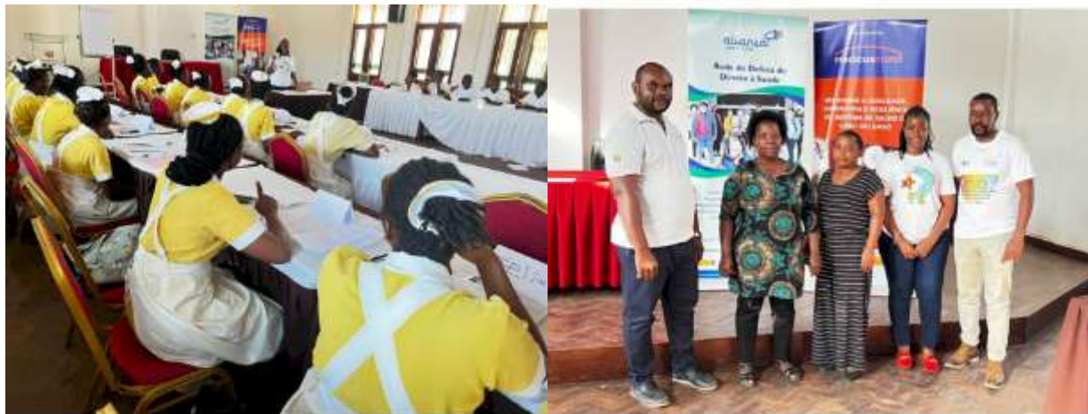
Fotos: Workshop sobre Humanização Obstétrica