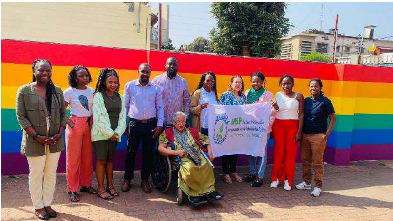
Fotos: Troca de experiências com MSP